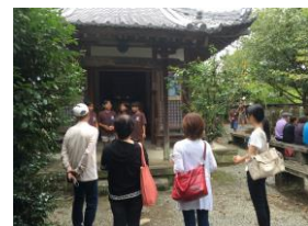
小学生ガイド による案内